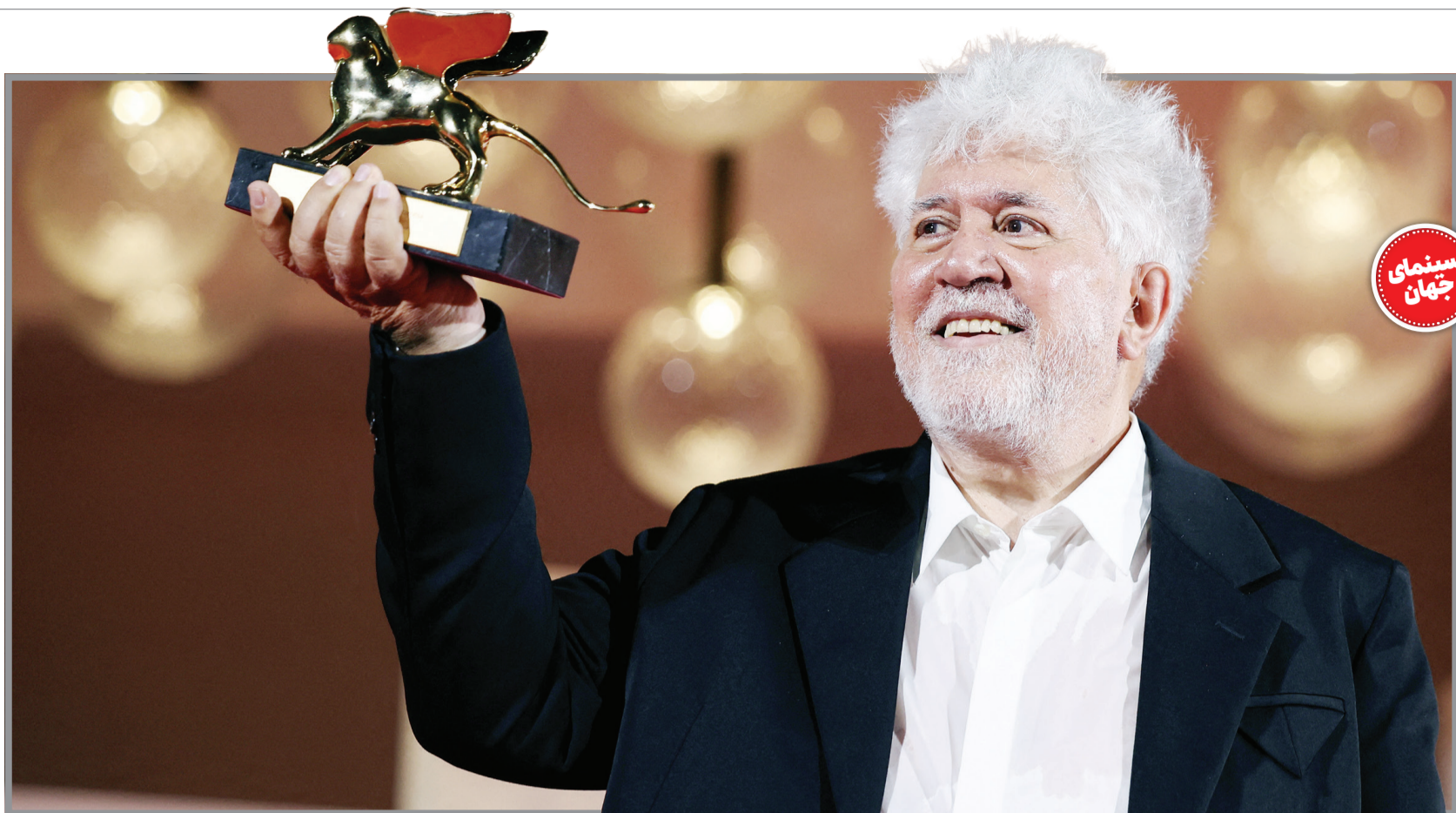
پدرو آلمودوار برنده شیر طلایی جشنواره ونیز شد

دست‌به‌دست شدن ویدئویی از بازی عجیب امیر مقاره، خواننده گروه ماکان بند روی صحنه نمایشی به نام «تیتانیوم» به نویسندگی و کارگردانی اشکان درویشی در شبکه اجتماعی ایکس (تویتر سابق)، بار دیگر موجب شکل‌گیری موجی اعتراضی علیه حضور افراد ناشنا با اصول اولیه هنر نمایش روی صحنه تئاتر شده است. ویدئویی از امیر مقاره که در صحنه‌ای از این نمایش با قطعه «گریه کن» با صدای همایون شجریان به‌شکلی عجیب به خود می‌پیچد و تظاهر به گریه کردن می‌کند، بارها و بارها در فضای مجازی چرخیده و هر بار به‌شکلی مورد انتقاد قرار گرفته است. حضور خوانندگان موسیقی پاپ و سلبریتی‌های فضای مجازی در نمایش‌های روی صحنه پیش از این نیز با انتقاد فعالین فرهنگی و هنری مواجه شده است. حضور امیر مقاره در نمایش «تیتانیوم» که در پردیس تئاتر شهرزاد روی صحنه رفت، دومین تجربه بازیگری او پس از بازی در سریال «جزیره» سیروس مقدم محسوب می‌شود.