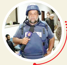
شمار شهدای خبرنگار غزه به ۱۰۹ نفر رسید

اصلاً کتاب «ایرانی تر»، روایت همین معناست و به همین دلیل دو بخش ایران و انبران دارد که این تعامل و همزیستی یک ایرانی و یک فرانسوی را بیان می‌کند. وقتی با یک انسان غربی در این سطح ارتباط داشته باشید، ارتباطی که بتوانید یکدیگر را کامل کنید به وجود می‌آید. من وقتی سال اول چین‌شناسی به دانشگاه رفتم، سرکلاس مانویت، استاد میشل تاردیو تا اسم مرا خواند، گفت شما چند سبستی با رضا تجدد دارید؟ وقتی فهمید پدرم است، با احترام ویژه‌ای با من برخورد کرد و گفت، شما باید به جای من پشت میز بنشینید. پدرم الفهرست ابن ندیم را تصحیح کرده بود