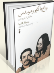
وداع با گابو و مرسدس نویسنده: رودریگو گارسیا مترجم: وازیبک درساهاکیان انتشارات: نشر نو

کتاب «وداع با گابو و مرسدس (خاطراتی از پدر و مادر)»، نوشته رودریگو گارسیا با ترجمه و ازبیک درساهاکیان با قیمت ۱۵۰ هزار تومان توسط انتشارات نشر نومنشر شد. در مارس ۲۰۱۴ گابریل گارسیا مارکز دچار سرماخوردگی شد. زنی که بیش از ۵۰ سال در کنار او بود، همسرش، مرسدس بارچا، امید چندانی به بهبودش نداشت؛ شوهرش، که از نزدیکان «گابو» صدایش می‌زدند، نزدیک ۸۷ سال داشت و با اختلال مشاعر دست‌وپنجه نرم می‌کرد. این بود که به پسرشان، رودریگو، گفت: «فکر نکنم از این یکی جان سالم بهدر ببریم.» رودریگو با شنیدن این حرف مادر از خودش پرسید: «پس این طورهاست که پایان شروع می‌شود؟» و تصمیم گرفت برای غلبه بر آنده و بار سنگین از دست دادن پدر، آخرین روزهای زندگی گارسیا مارکز را با کاغذ بیاورد. نتیجه کار، گزارشی صمیمانه و صادفانه شد. داستان بر محور مردی می‌چرخد که جسم و جانش در حال زوال کامل است، اما هنوز طغری قوی دارد. او از اطرافیانش محبت و توجه طلب می‌کند و در همان حال می‌کوشد همه‌ی توش و توان خود را در حفظ آخرین علامت حیات به‌کار گیرد.