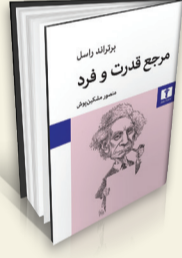
مرجع قدرت و فرد نویسنده: برتراند راسل مترجم: منصور مشکین‌پوش انتشارات: نیلوفر

کتاب «مرجع قدرت و فرد» نوشته برتراند راسل، با ترجمه منصور مشکین‌پوش در ۱۴۱ صفحه، با قیمت ۱۴۵ هزار تومان توسط انتشارات نیلوفر منتشر شده است. برتراند آرتور ویلیام راسل، ازل راسل سوم، معروف به برتراند راسل، فیلسوف قرن بیستمی بریتانیایی است. راسل از بنیان‌گذاران سنت مدرن تحلیلی، برنده جایزه صلح نوبل، فعال ضد جنگ و مخالف امپریالیسم بود. عمده شهرت او علاوه بر فلسفه به دلیل فعالیت‌های سیاسی صلح‌طلبانه‌اش بود. از آثار مطرحی از جمله «مسائل فلسفه»، «تحلیل ذهن» و «شرح انتقادی فلسفه لایبنیتس» به‌جا مانده است. کتاب «مرجع قدرت و فرد» متن شش سخنرانی راسل در سال‌های ۱۹۴۹-۱۹۴۸ است که از شبکه بی‌بی‌سی پخش شدند. این سخنرانی‌ها در رابطه با سازش میان مرجع قدرت و آزادی فردی است که در قالب بحثی روشن‌شناختی درباره سرچشمه‌های کنش اجتماعی، مروری تاریخی بر دامنه و شدت نظرات دولتی و بیان نقش فرد در تاریخ هنر، علم، دین و اخلاق مطرح می‌شود.