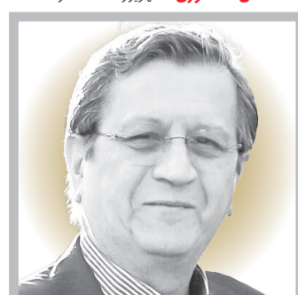
عبدالناصر همتی از ۳۱ مرداد ۱۴۰۳ تا امروز