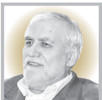
صدر حسینی شهریور ۱۳۸۳ تا مرداد ۱۳۸۴