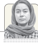
سارا سینی خبرنگار گروه جامعه

«ما دیگر دور جزیره کیش، ماهی پیدا نمی‌کنیم. این جزیره بهترین ماهی خلیج فارس را داشت، توره‌های محاصره‌ای همه آنها را صید کرده‌اند.» این‌ها را یکی از صیادان جزیره کیش می‌گوید که دیگر خودش و همکارانش نمی‌توانند به راحتی کارشان را در دریا ادامه دهند؛ چون لنج‌هایی که با توره‌های محاصره‌ای صید می‌کنند، سهم آنها را از دریا می‌برند و چیزی برای صیادهای سنتی که با قلاب ماهی می‌گیرند، باقی نمی‌ماند. رواج استفاده از این توره‌ها معیشت‌شان را به شدت تحت تاثیر قرار داده و اگر متوقف نشود، حیات و زاد و ولد آبریزان خلیج فارس را هم تخریب می‌کند.