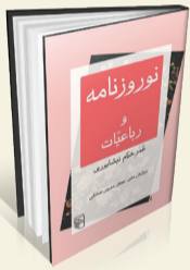
نوروزنامه و رباعیات ویرایش: جعفر مدرس صادقی انتشارات: مرکز

«نوروزنامه و رباعیات» عمر خیام نیشابوری، با ویرایش جعفر مدرس صادقی در ۱۴۴ صفحه و با قیمت ۱۸۵ هزار تومان توسط نشر مرکز منتشر شده است. «نوروزنامه و رباعیات» یکی از معدود رساله‌های فارسی به‌جامانده از حکیم عمر خیام نیشابوری، سیزدهمین کتابی است که از مجموعه «بازخوانی متون» نشر مرکز منتشر می‌شود. در این مجموعه، برجسته‌ترین متون ادبیات کلاسیک فارسی با فصل‌بندی و تدوین مجدد به‌صورتی عرضه شده‌اند که تمامیت و قمر اثر محفوظ بماند. ضمن اینکه ویرایش‌های جدید این مجموعه گزیده نیست و بازنویسی هم نیست، بلکه عین خود متن در برابر خواننده است و هیچ حرکتی در جهت ساده‌سازی و هیچ‌گونه اعمال سلیقه‌ای به منظور تعدیل زبان متن در کار نبوده است. «نوروزنامه و رباعیات» عمر خیام نیشابوری از مجموعه بازخوانی متون با ویرایش جعفر مدرس صادقی هم درباره نوروز و خاستگاه ایرانی آن است؛ آن هم به قلم خیام و هم درباره خود این دانشمند ایرانی نکاتی دارد و ویرایشی تازه از رباعیات عالم‌گیرش عرضه کرده است.