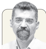
مهررداد خدیر معاون سردبیر

نمی‌کند. مضمون اصلی جمله کلیدی و طلایی جمشید مشایخی در آن برنامه تلویزیونی که گویا گفت تا رازی را به گور نبرد این بود که «اگر طلاق می‌داد دیگر تختی نبود و اگر هم طلاق نمی‌داد باز تختی نبود» ولی جفاست اگر تصور کنیم تنها خانه بر جهان پهلوان تنگ شده بود چرا که بیرون تنگ‌تر بود. این حس را بهرام توکلی که البته نسبتی با شهلا توکلی ندارد در فیلم «تختی» منتقل کرده است. همان صحنه که تختی مجنون‌وار، کار پدر را در میخ کوفتن بیهوده تکرار می‌کند و سخت تکان دهنده است و اشک بر چشم می‌نشانند. علی حاتمی فرصت نیافت که فیلم تختی را به پایان برساند اما فیلم‌نامه موجود و مشخص است کارگردان فقید برای سکانس پایانی چه در سر داشته است. روایت او هم خودکشی است منتها نه به اختیار که به اجبار و با مداخله مستقیم از بیرون. این روایت هم البته در سال‌های اخیر کم‌رنگ شده ولی نقل بخش پایانی فیلمی که سعیدی سینمای ایران نوشته، نشان‌دهنده ذهنیت سال‌های قبل‌تر است و نقل آن خالی از لطف نیست: «تلفن قطع می‌شود. جهان پهلوان با تعجب گوشی را می‌گذارد. کاغذی از زیر در به داخل فرستاده می‌شود. جهان پهلوان کاغذ را باز می‌کند. این متن روی آن نوشته شده است: «این نامه را به خط خودتان بنویسید:» حضور مبارک آقای دادستان، این ورقه وصیت‌نامه اینجانب است. تمنایی که از جناب‌عالی دارم این است که اولاً مهریه زخم هر چه هست بدهید. بیشتر راضی نیستم، ثانیاً از هیچ کس گله و شکایت و ناراحتی ندارم. خودم این تصمیم را گرفتم و احدی در کار من دخالت ندارد. غلامرضا تختی ۱۳۴۶/۱۰/۱۶ ❏