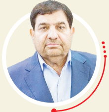
محمد مخبر، سرپرست ریاست جمهوری: