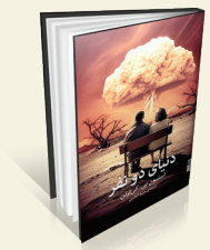
دنیای دو نفر نویسنده: استیون پی. کی‌یرن مترجم: مریم الماسی انتشارات: برج

رمان «دنیای دو نفر»، نوشته استیون پی. کی‌یرن، ترجمه مریم الماسی در ۵۱۰ صفحه و با قیمت ۲۲۵ هزار تومان توسط نشر برج منتشر شده است. استیون پی. کی‌یرن، در «دنیای دو نفر» سراغ شخصیتی واقعی به‌نام چارلی فیسک رفته است، ریاضی‌دان با استعدادی که به پروژه منهن دعوت شد و بدون در نظر گرفتن اخلاقیاتش، وظیفه ساخت چاشنی بمب اتم را به او سپردند؛ بی‌آنکه از نتیجه کاری که به نفع او مشغول بود، آگاهش کنند. او در کنار چهره‌هایی همچون رابرت اوپنهایمر، بر سر دوراهی سرنوشت‌ساز بهره‌گرفتن از علم برای خدمت یا خیانت به بشر، تا مرز فروپاشی رفت. حالا نسخه داستانی او، چارلی فیسک، بعد از جنگ، کنار همسر نوازنده اش و در جست‌وجوی رستگاری زندگی می‌گذراند، رستگاری‌ای که پس از انفجار بمب‌های اتمی در هیروشیما و ناگاساکی، آسان به دست نمی‌آید. روزنامه پیتربورگ لجر در مورد این رمان نوشته است: «مثل همه داستان‌های تاریخی بزرگ، اسنادانه تحقیق شده و به‌خوبی روایت شده است.»