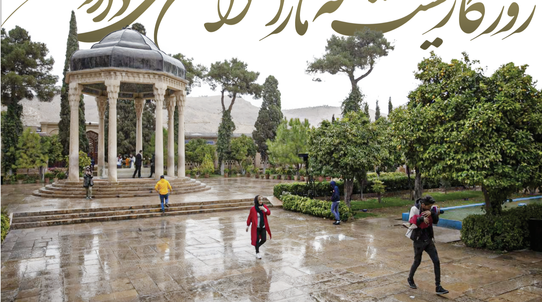
نگار: رضا قادری/ایرنا