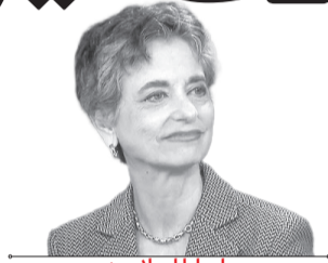
باربارا اسلاوین رئیس‌مجلس اندیشکده استیمسون