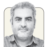
محمد جواد روح

یک روز پس از قطعی شدن انتصاب نخستین معاون اهل سنت که همزمان با انتصاب یک استاندار اهل سنت دیگر این بار برای سیستان و بلوچستان در دولت مسعود پزشکیان بود، رئیس‌جمهور راهی قم شد تا با مراجع تقلید شیعه دیدار کند؛ مراجع تقلیدی که پزشکیان با آنان دیدار کرد، از فقهایی هستند که عموماً گرایش‌های سنتی‌مذهب شیعه را نمایندگی می‌کنند. از این‌رو، چنین دیداری پس از آن انتصابات که با استقبال علمای اهل سنت از جمله مولوی عبدالحمید