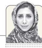
زهرا جعفرزاده خبرنگار گروه جامعه

چهارشنبه هفته گذشته، مجمع تشخیص مصلحت نظام، آب‌پاکی را بر دست دانش‌آموزان و خانواده‌هایشان ریخت. آنها مصوبه نمایندگان مجلس برای مهلت سه‌ساله جهت اجرای مصوبه شورای عالی انقلاب فرهنگی را رد کردند و حالا تنها امید به رویکرد جدید دولت آقای پزشکیان به مصوبه شورای عالی انقلاب فرهنگی است