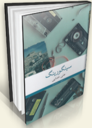
سینگورینگ نویسنده: علی خدایی انتشارات: چشمه

«سینگورینگ» نوشته علی‌خدایی در ۱۶۰ صفحه و با قیمت ۲۲۰ هزار تومان توسط نشر چشمه منتشر شد. خدایی در این اثر مانند سایر آثار گذشته‌اش، نوستالژی‌های کودکی و جوانی‌اش را مرور کرده و به‌سینماها، مدرسه‌ها، کتاب‌فروشی‌ها، خانه‌ها و خیابان‌هایی سرزده که حالا یا نیستند یا اسم‌شان عوض شده یا رسم‌شان، بعضی آدم‌ها، بعضی احساس‌ها که شاید دیگری از آن‌ها در جایی پیدا نشود. خدایی شهر را، اصفهان، تهران و خیابان‌ها و کوچه‌ها را دست‌مایه قرار می‌دهد تا اتمسفری غلیظ از مهر و غم توأمان بسازد. او مزه‌ها را از پس سال‌ها و دهه‌ها بیرون می‌کشد و یادمان می‌آورد که در کجای چهارباغ کدام