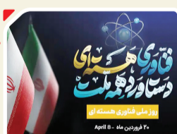
روز ملی فناوری هسته‌ای ۲۰ فروردین ۱۳۳۶

ایران در سال ۱۳۳۶ به عضویت آژانس بین‌المللی انرژی اتمی درآمد و در سال ۱۳۴۶، پیمان عدم تکثیر سلاح‌های هسته‌ای را پذیرفت. یک سال بعد نخستین راکتور تحقیقاتی آب سبک از آمریکا خریداری شد و در دانشگاه تهران راه‌اندازی شد. سازمان انرژی اتمی نیز در سال ۱۳۵۳ بنیاد گذاشته شد. بعد از انقلاب ۱۳۵۷ نیز فعالیت‌های هسته‌ای ایران ادامه یافت تا اینکه ۲۰ فروردین‌ماه ۱۳۸۵ خبر دستیابی کشور به فناوری صلح‌آمیز هسته‌ای و راه‌اندازی ریزجبره کامل غنی‌سازی اورانیوم اعلام شد. پس از آن شورای عالی انقلاب‌فرهنگی در جلسه‌ای در شهر پورماه همان سال، نام‌گذاری روز ۲۰ فروردین‌ماه را به‌عنوان «روز ملی فناوری هسته‌ای» به پاس قدردانی از تلاش‌های دانشمندان جوان ایران اسلامی، تصویب کرد. هر ساله، مراسمی در این روز در ایران برگزار می‌شود و دستاوردهای هسته‌ای جدیدی رونمایی می‌شوند. به‌تازگی نیز معاون رئیس‌جمهور و رئیس سازمان انرژی اتمی از رونمایی ۹ دستاورد جدید این سازمان شامل سه دستاورد در حوزه رادیودارو، دو دستاورد در حوزه پلاسما و چهار دستاورد دیگر در حوزه صنعتی در بخش مربوط به لیزر، عکسبرداری و سیستم‌های کنترلی خبر داده است.