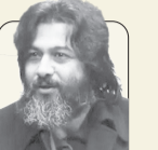
سیدعبدالجواد موسوی روزنامه‌نگار و شاعر