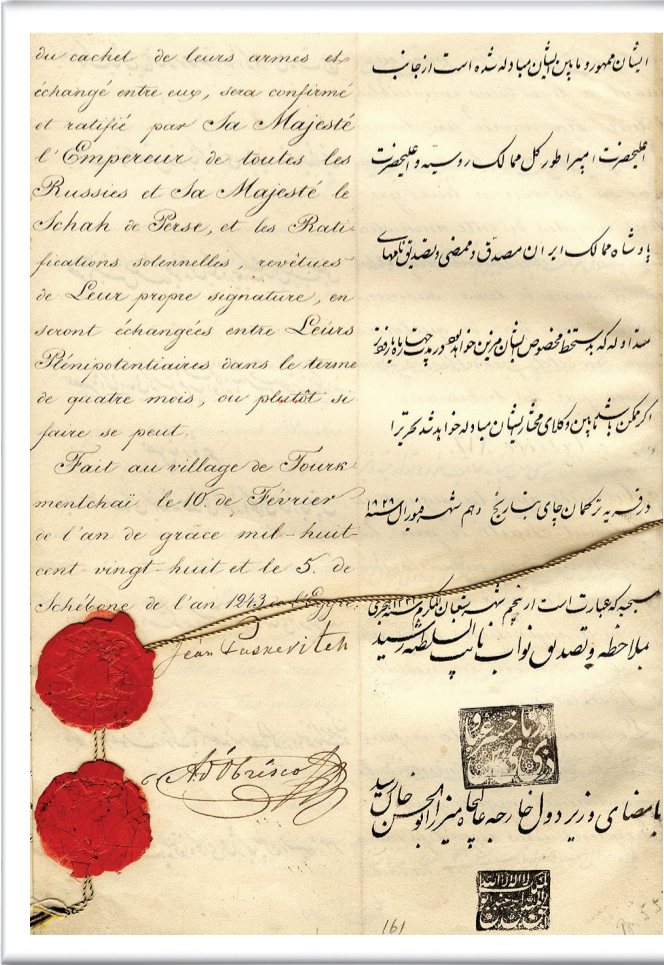
صفحه آخر قرارداد ترکمنچای به زبان روسی و فارسی