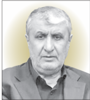
محمد اسلامی معاون رئیس‌جمهور و رئیس سازمان انرژی اتمی