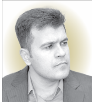
حسین افشین معاون علمی و فناوری ریاست‌جمهوری