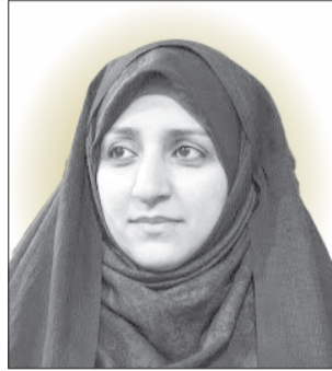
زهرا بهروز آذر معاون رئیس‌جمهور در امور زنان و خانواده