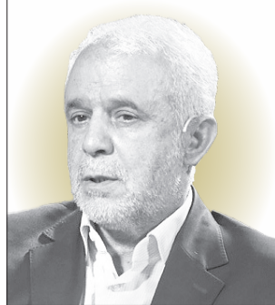
سعید اوحدی معاون رئیس‌جمهور و رئیس بنیاد شهید