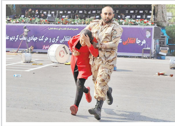
حمله تروریستی به رژه نیروهای مسلح در اهواز، ۱۳۹۷