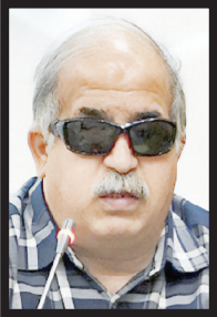
سپیل معینی مدیرعامل انجمن باور: