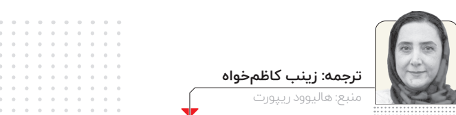
ترجمه: زینب کاظم‌خواه