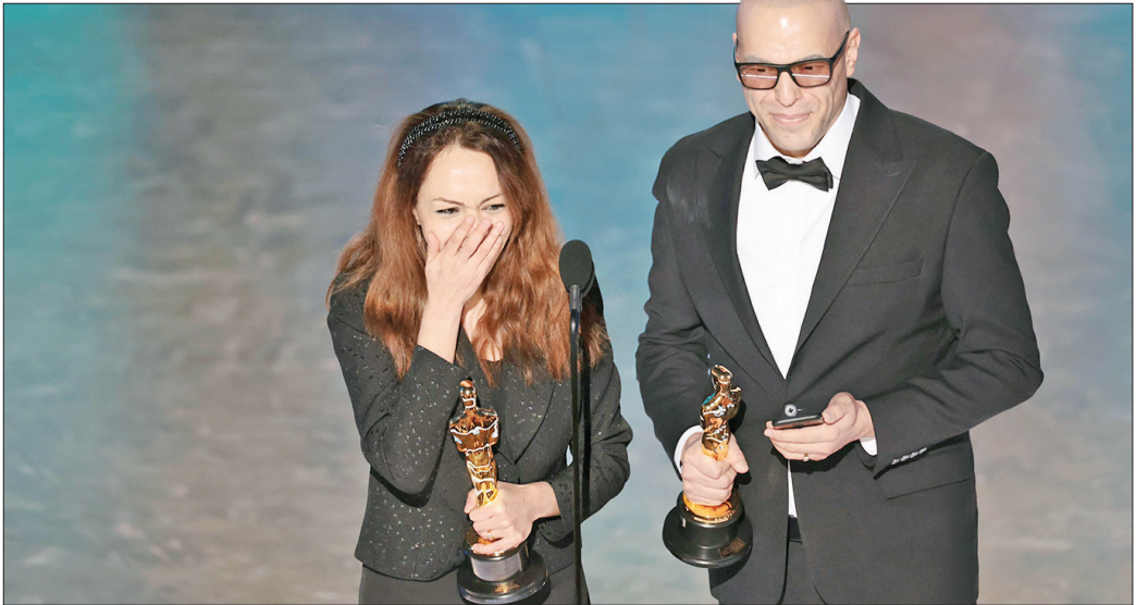
شیرین موهانی و حسین مالینی در نود و هفتمین دوره جوایز اسکار

تلفن روابط عمومی: ۸۸۷۴۹۳۰۰ • تحریریه: ۸۸۷۳۰۲۹۱ • آگهی‌ها: ۸۸۷۳۵۲۰۷ • نشانی: خیابان شهید بهشتی، خیابان پاکستان، کوچه دوازدهم، پلاک ۱۸ • لیتوگرافی و چاپ: هم‌میهن • تلفن چاپخانه: ۰۲۱۴۶۸۲۱۱۱۴ • توزیع: نشر گستر امروز نوین • تلفن: ۰۲۱-۹۱۳۰۴۱۴۲