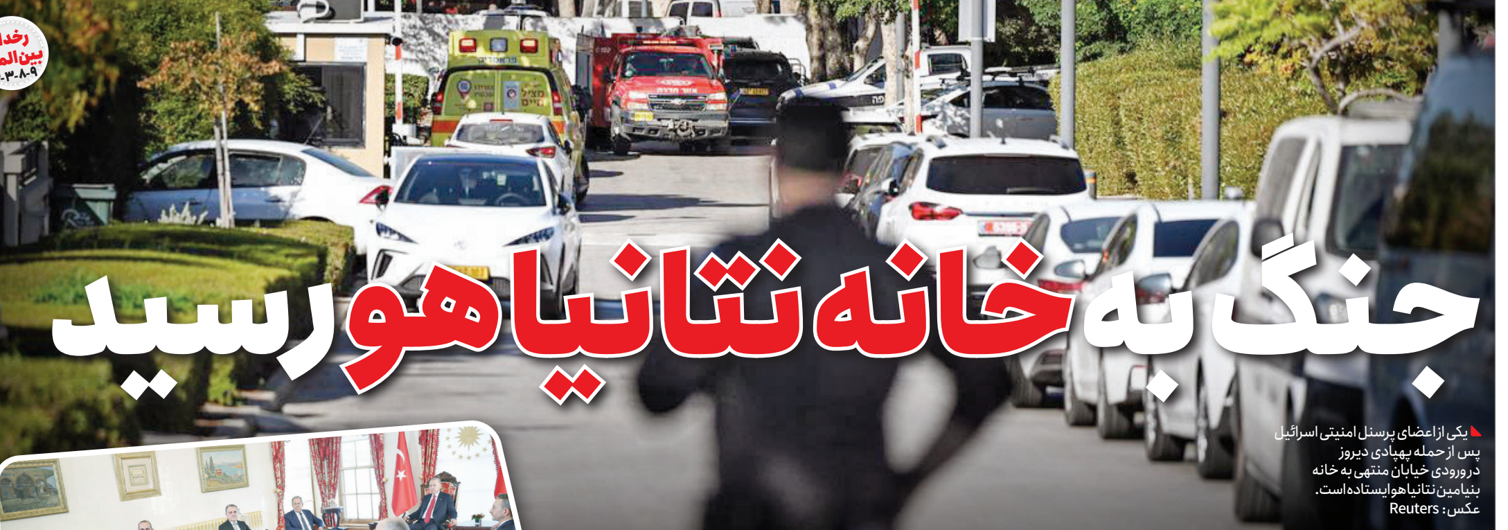
یکی از اعضای پرسنل امنیتی اسرائیل پس از حمله بهیادی دیروز در ورودی خیابان منتهی به خانه بنیامین نتانیاها ایستاده است.