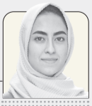
سیا دادخواه خبرنگار فرهنگ

لاید، این اشعار همچنان زبانی مردانه دارند و این سوال برایشان مطرح بود که مگر اصلاً می‌شود یک زن این‌گونه استوار و خردگرا، شعر بگوید و با مردان در این عرصه رقابت کند؟ بعدها نیز برخی بزرگان، به گواهی نشانه‌هایی از درون شعر پروین و علی‌الخصوص شعر -زیست شخصی‌اش-، در مدحی شبیه به ذم، او را «زنی مردانه در قلمرو شعر و عرفان» خطاب کردند. این نگاه تا جایی بر او سایه افکنده بود که حتی برگزیدن تخلص و بعد نام «پروین» برای او مجاز نبود؛ چراکه این نام بر زنان مرسوم نبود و او بر دفاع برآمده