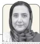
زینب کاظم‌خواه خبرنگار گروه فرهنگ

سیلوستر استالونه که همه او را به خاطر بازی در سری فیلم‌های راکسی می‌شناسند در سریال «پادشاه تالسا» به ایفای نقش پرداخته است. فصل اول این سریال در نوامبر ۲۰۲۲ از پارامونت پلاس پخش شد و حالا فصل دوم این سریال به‌تازگی پخش شده است.