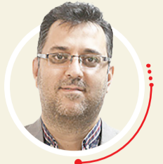
هشدار وزارت بهداشت درباره موج گرما