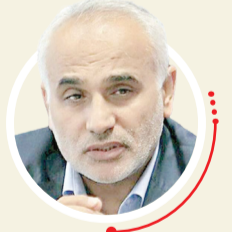
آلودگی ۹ استان به پشه آندس