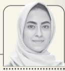
سبا دادخواه خبرنگار فرهنگ