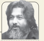
عبدالجواد موسوی شاعر و روزنامه‌نگار