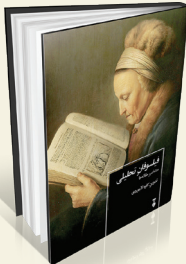
فیلسوفان تحلیلی (منتخب مقاله‌ها) تدوین: کاوه لاجوردی انتشارات: نشر نو

«فیلسوفان تحلیلی (منتخب مقاله‌ها)»، تدوین شده توسط کاوه لاجوردی در ۲۵۱ صفحه و با قیمت ۳۲۰ هزار تومان توسط نشر نو منتشر شده است. این مجلد که توسط گروه مترجمان ترجمه شده و تدوین آن برعهده کاوه لاجوردی بوده است، حاوی ترجمه ۱۰ مقاله کلاسیک فلسفه تحلیلی است: دو مقاله در الهیات فلسفی، چهار مقاله در فلسفه کنش، دو مقاله در زیبایی‌شناسی، یک مقاله در فلسفه ذهن و یک مقاله در معرفت‌شناسی. این مقاله‌ها در سال‌های ۱۹۵۹ تا ۱۹۸۸ منتشر شده‌اند. مقاله‌های این مجلد شامل «منطق همه‌توانی» (هری فرنکفورت)، «آیا خداوند باید بهترین را خلق کند؟» (رابرت ادمز)، «سازگاری اخلاقی» (برنارد ویلیامز)، «امکان‌های بدیل و مسئولیت اخلاقی» (هری فرنکفورت)، «ضعف اراده چگونه ممکن است؟» (دانلد دیویدسن)، «واقع‌انگاری اخلاقی و دوره‌های اخلاقی» (فیلیپ فوت)، «مفاهیم زیبایی‌شناختی» (فرنک سیبلی)، «مقوله‌های هنر» (کنندال والتن)، «کواینین کیوف» (دنیل دیت) و «استنباط‌بهترین تبیین» (گیلبرت هارمن) است. مترجمان این مقالات کاوه لاجوردی، میثم محمدامینی، ساره امیری، سیدمحسن اسلامی، یاسر پوراسماعیل و مرزویه ابراهیمی بوده‌اند.