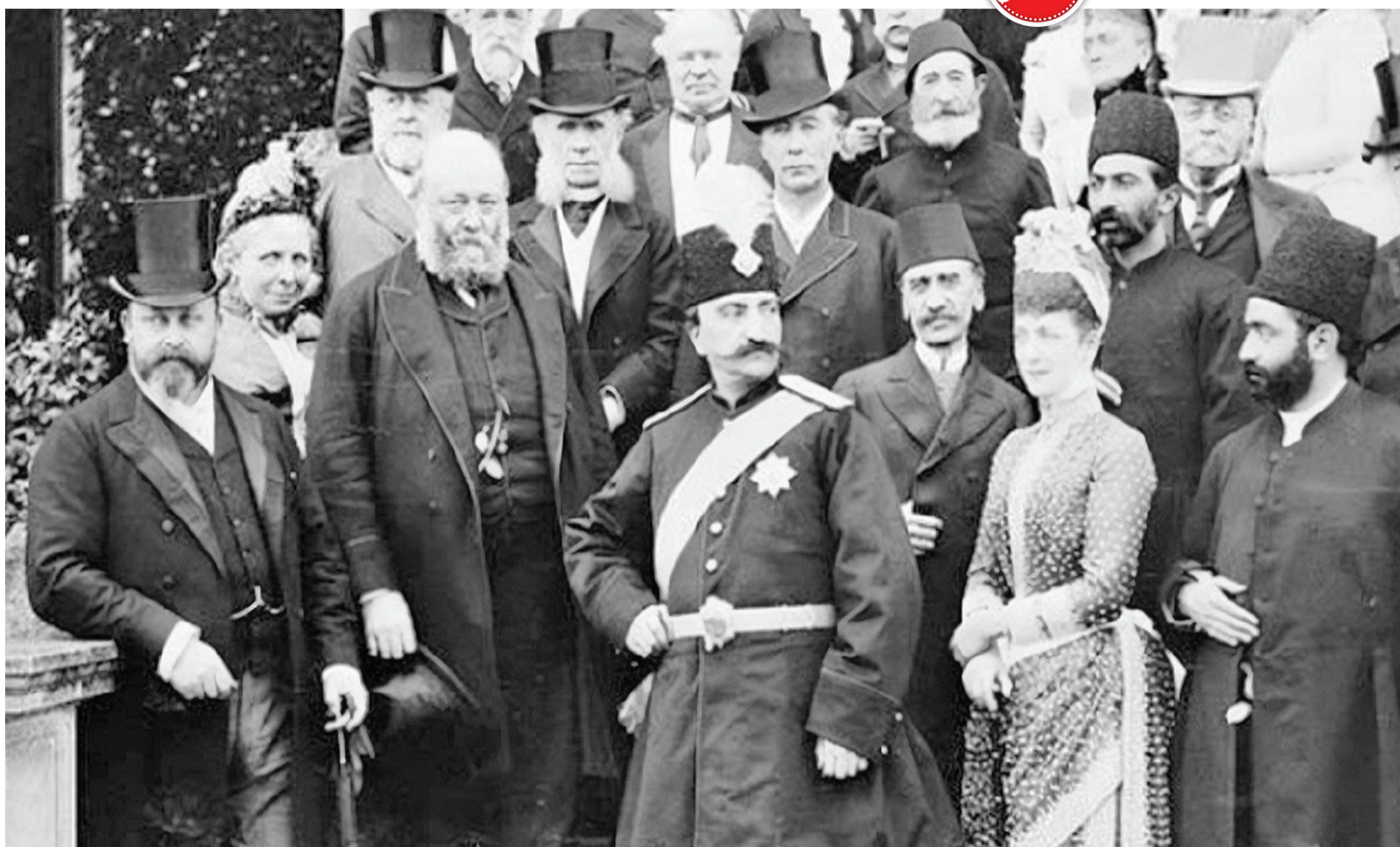
قرارداد تالیوت در جریان سفر سوم ناصرالدین شاه به اروپا بسته شد

چگونه امتیاز انحصاری خرید و فروش توتون و تنباکو یا قرارداد رژی سرشت سیاسی قاجار را تغییر داد؟