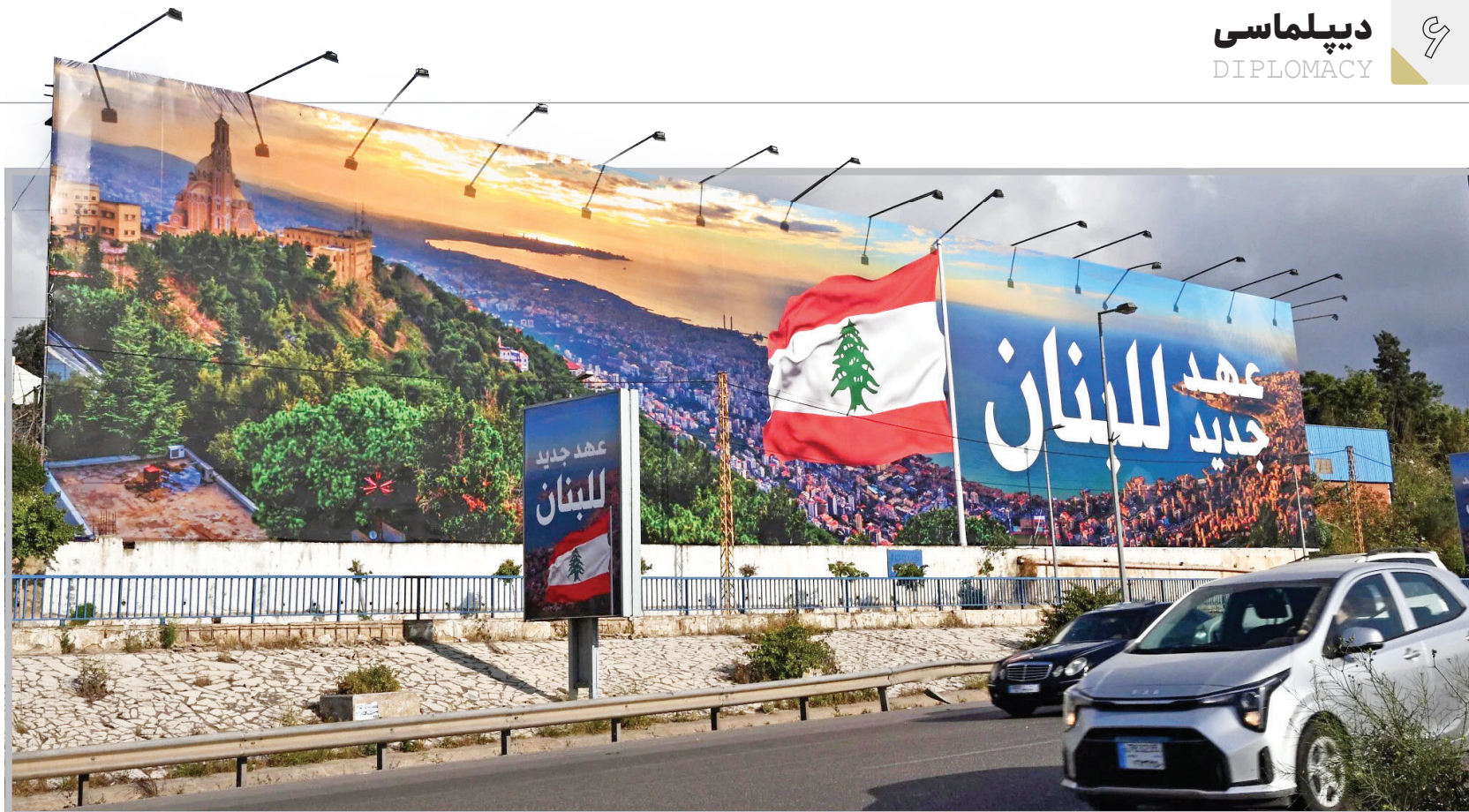
ارتش لبنان نشان‌های حزب‌الله را از جاده فرودگاه بیروت جمع‌آوری کرد. در بزرگی که جایگزین بنویس تصویر بسید هاشم صافی‌الدین، از رهبران حزب‌الله شد، نوشته شده است: «دوران جدید لبنان!»

آنچه در این ستون می‌خوانید، دیدگاه‌های رسانه‌های خارجی است که صرفاً جهت اطلاع‌رسانی منتشر می‌شود و این دیدگاه‌ها موضع روزنامه «هم‌میهن» نیست.